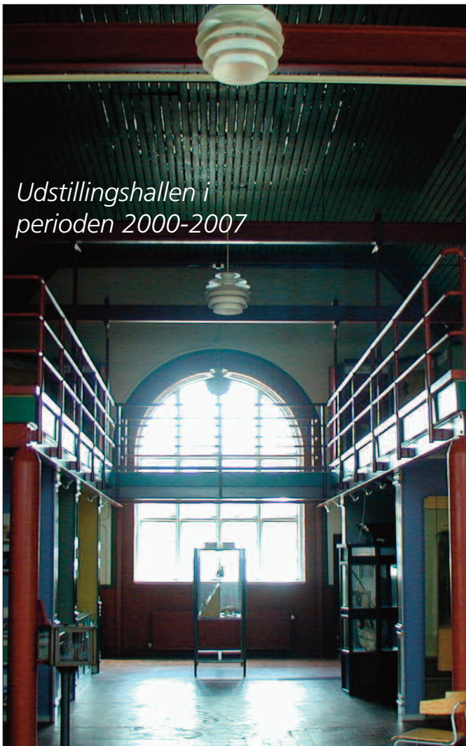
Udstillingshallen i perioden 2000-2007