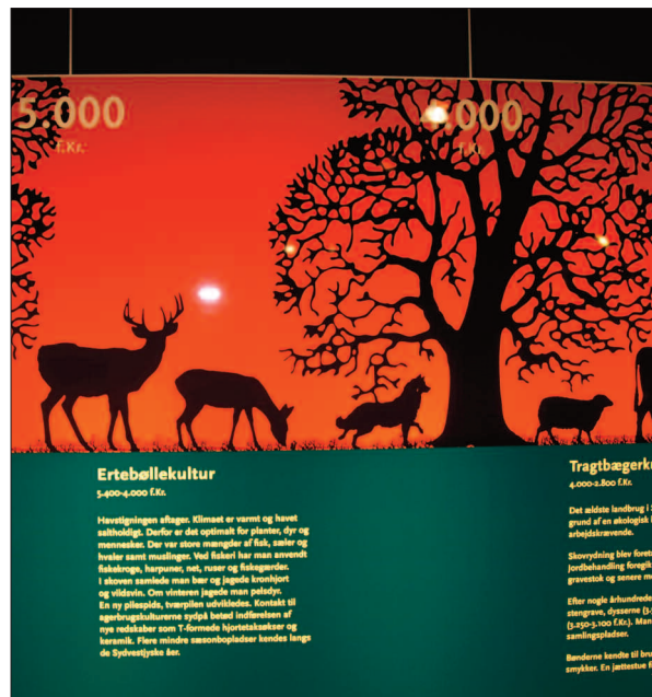
En af museets tidstavler fra 2009.

I 2011 var året, hvor Esbjerg Kommune bekostede forsatsvinduer i den store hal, hvilket gjorde det muligt at afholde arrangementer om vinteren, ligesom varmebesparelsen blev mærkbar.