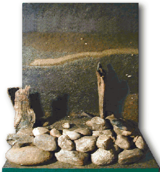
1500 år gammel jernalderbrønd fra Kirkebro-bopladsen. Den er købt af Bramming Kommune og har været udstillet på museet siden 1994.

I 1993-1994 foretog Esbjerg Museum en omfattende arkæologisk udgravning af en boplads fra yngre jernalder ved den nye omfartsvej. Lokaliteten kaldtes Kirkebro 10 . Bramming Egnsmuseum gik ind i dette arbejde og skaffede ekstra midler fra Byrådet til bl.a. indkvartering og en skurvogn. Den anden del af udgravningen fungerede som en uddannelsesudgravning for arkæologistuderende ved Københavns Universitet. Det betød, at museet kunne overtage de velbevarede rester af en jernalderbrønd, der siden indgik som en del af museets faste udstilling samt låne genstande fra den første udgravning.