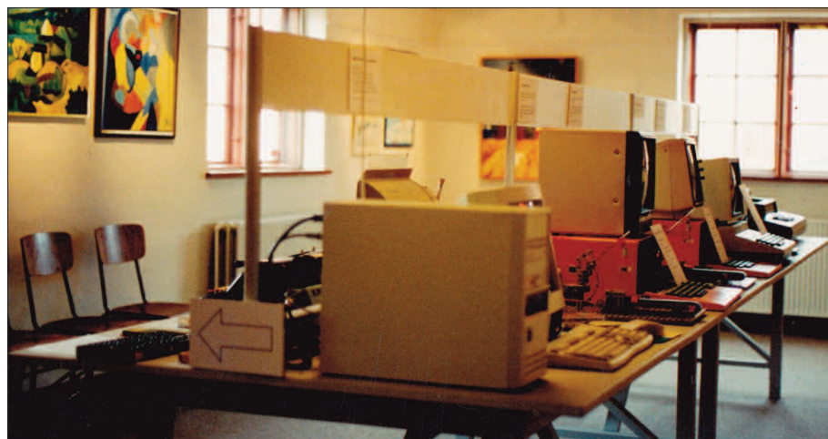
Edb-udstillingen, museets første særudstilling, skabt af Bent Jacobsen.