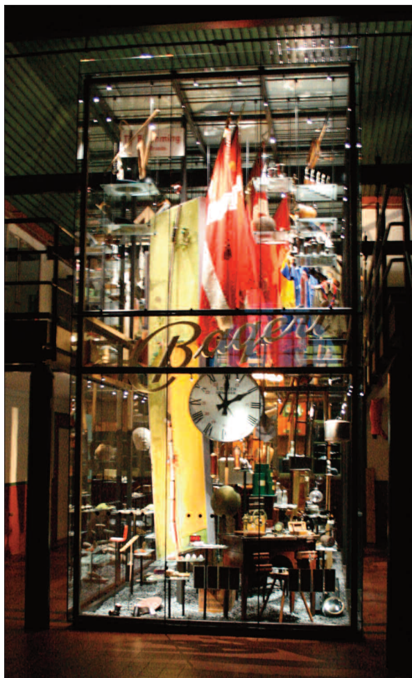
HISTORIUM i aftenbelysning i 2007